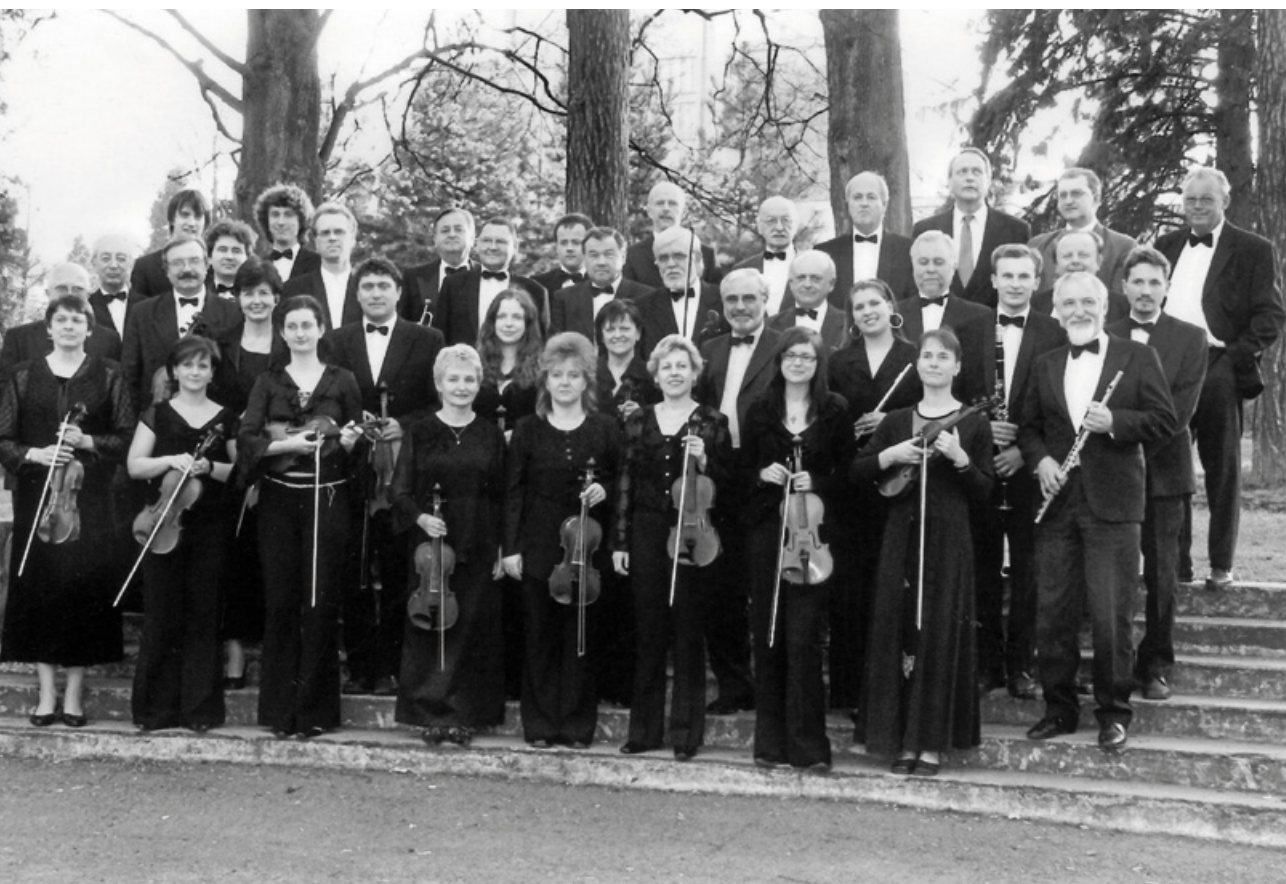
duben 2007, park nad Smetanovým domem, foto k 60. výročí LSO